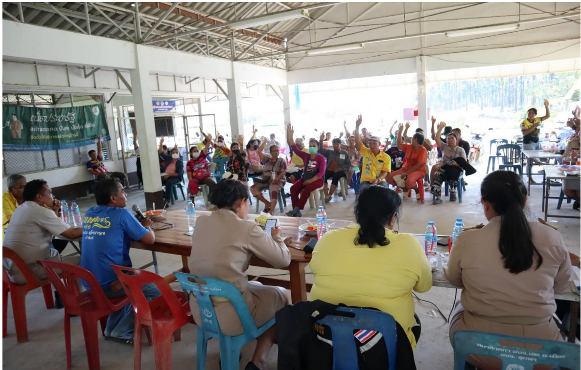
ภาพประกอบการประชุมประชาคม (ระดับหมู่บ้าน) ในการรับฟังความคิดเห็นของพี่น้องประชาชน